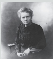
Musée Curie